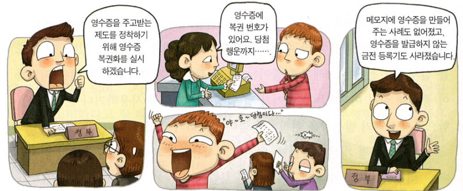
- 『고등학교 경제』