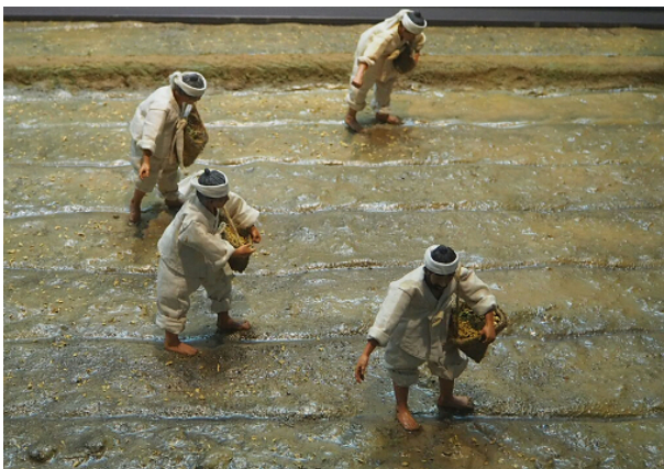
그림 1: 직파 모심 (농업박물관 전시 모형)