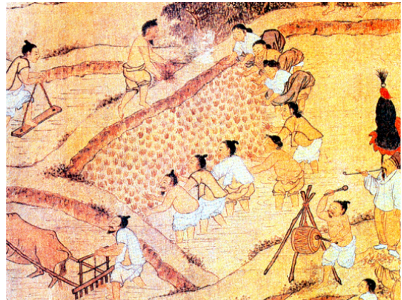
그림 2: 모내기 모심 (김홍도 풍속화)

조선 후기 농업의 새로운 흐름으로 모내기법(이앙법)이 널리 보급되는 현상이 나타났다. 당시 농농사의 파종(播種) 방식은 크게 직파법과 모내기법으로 나뉜다. 직파법은 물을 던 눈에 법씨를 직접 뿌려 수확할 때까지 재배하는 방법이고(그림 1), 모내기법은 모판에 법씨를 뿌렸다가 벼 모가 일정 크기로 자라면 본 눈에 옮겨 심는 방법이다(그림 2). 모내기법은 잡초를 제거하는 김매기 횃수를 줄여 노동력을 절감하고, 생산량도 크게 늘려 주었다. 또한 본 눈에서는 5월까지 가을보리를 재배하는 것이 가능했기에 1년에 두 번 경작할 수 있었다.