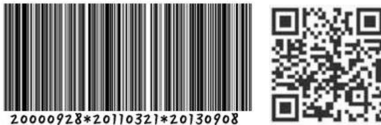
<그림 1> 바코드(좌)와 QR코드(우)

【다】 QR코드(Quick Response code)는 2차원 바코드로 일반 바코드보다 더 많은 정보를 담을 수 있으며 주로 휴대 전화로 읽어 낸 정보를 웹사이트에서 처리하는 용도로 사용된다. - 『고등학교 과학 교과서』