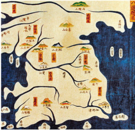
[그림 2] 조선국지리도 중 팔도총도