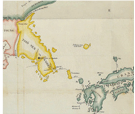
[그림 3] 삼국점양지도(프랑스어판 일부)