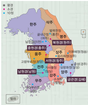
<통일신라의 9주 5소경>

삼국통일 직후, 통일신라 는 삼국을 하나로 통일했음을 뜻하는 삼한일통의식(三韓一統意識)이라는 새로운 통합 정체성을 내세우고, 이를 바탕으로 옛 고구려인, 백제인, 신라인을 하나로 묶는 삼국유민 통합정책을 추진했다. 통일신라는 하나의 독립된 천하를 상징하는 중국의 9주제를 도입하여 전국을 9개 주로 편성하였는데, 삼국의 옛 땅에 각각 3개 주를 두어 대등하게 대하면서도 하나로 통합하려 했다.