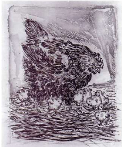
〈그림 1〉 「암탉과 병아리들」