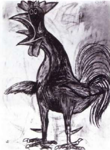
〈그림 2〉 「수탉」