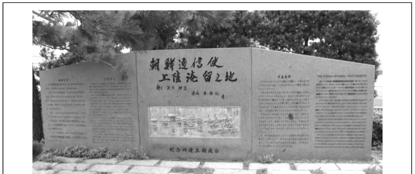
조선통신사 상륙엄류지 지 기념비

이 비는 통신사가 시모노세키에 기항*했던 것을 기념하고자 세운 것이다. 통신사는 전쟁 이후 단절된 조선과의 국교 재개를 바라는 (가) 막부의 요구를 받아들여 파견되었다. 이후 19세기 초까지 파견되어 조선과 일본의 평화 유지와 문물 교류에 기여하였다.