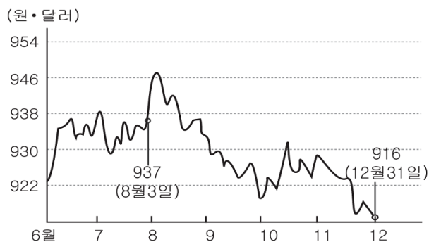
< 보기 >