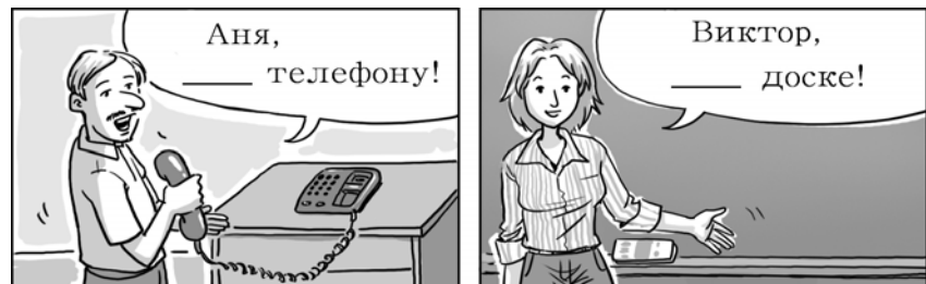
* доска : 칠판