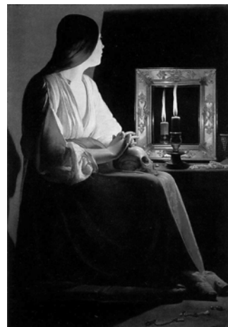
<라 투르의 ‘두 개의 불꽃 앞의 막달라 마리아’>

22. 위 글을 바탕으로 하여 아래의 그림을 감상한 내용으로 가장 적절한 것은?